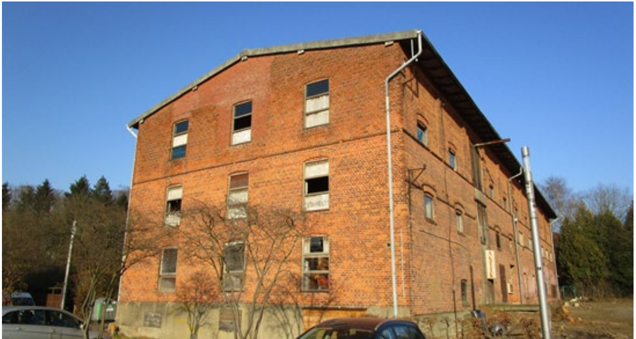
Abb.12: Speichergebäude am Gutshof