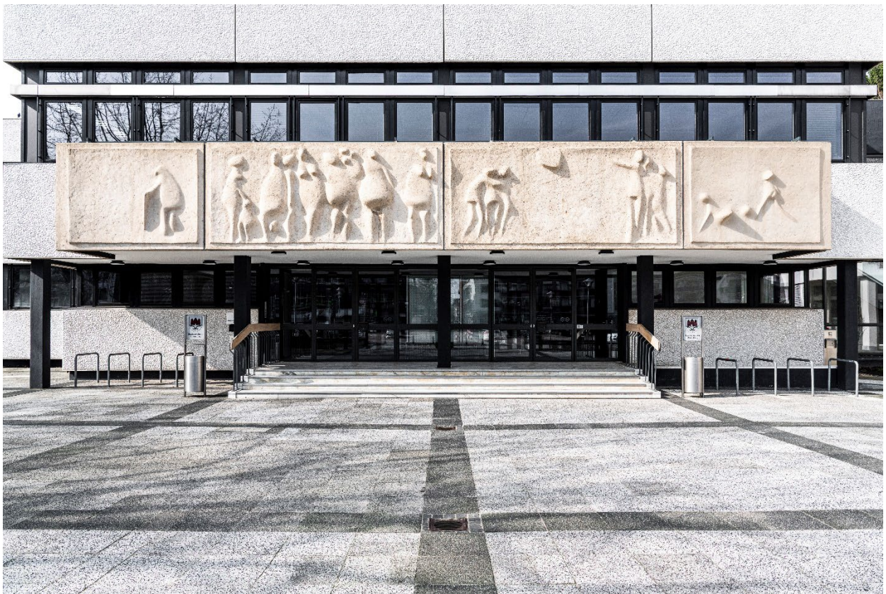
Abb.9: Saniertes Rathaus Stadt Ahrensburg, Detailaufnahmen