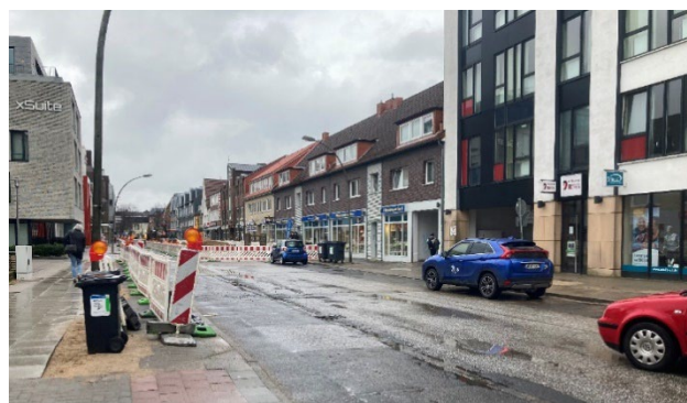
Abb.6: Umsetzungsstand Ordnungsmaßnahme „Neugestaltung Hamburger Straße/Rondeel“