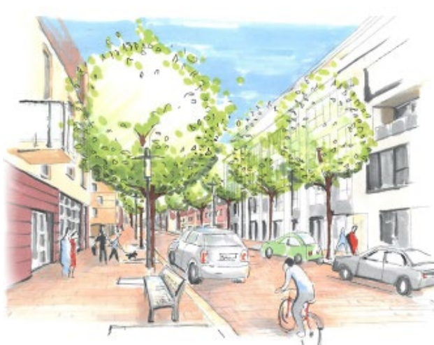
Abb.7: Hamburger Straße historisch und Planung