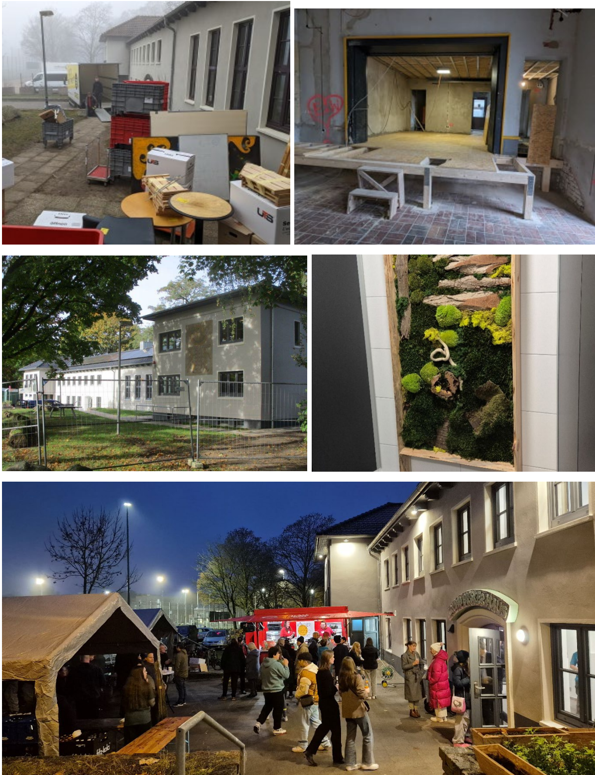
Abb.10: Sanierung Bruno-Bröker-Haus