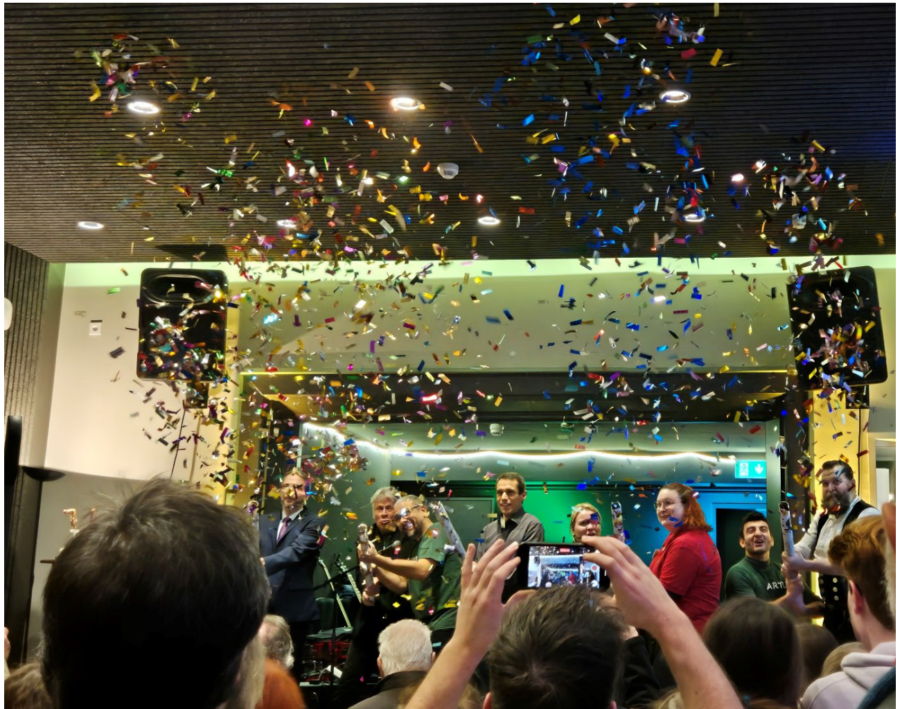
Abb.11: Sanierung Bruno-Bröker-Haus, Einweihungsfeier