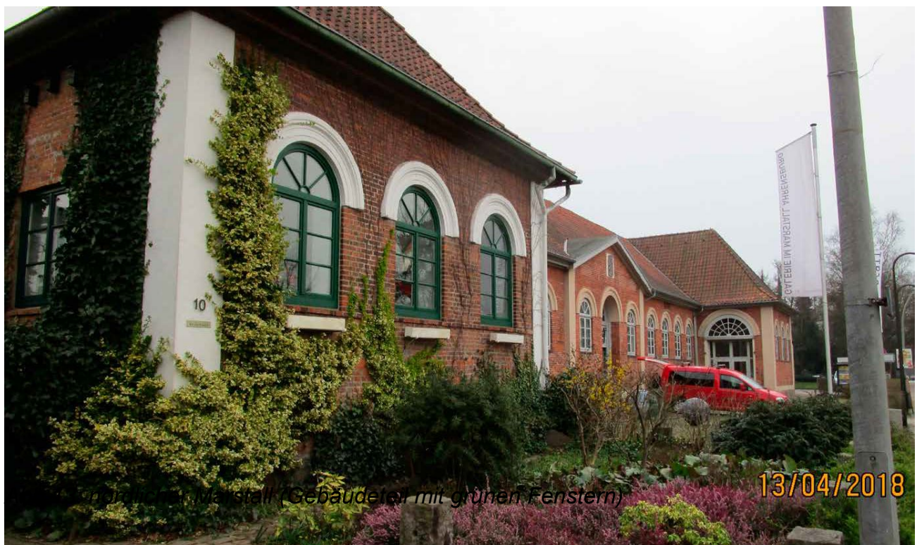
nördlicher Marstall (Gebäude mit grünen Fenstern)